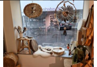
Ganzes Schaufenster allein 250.-/Mte