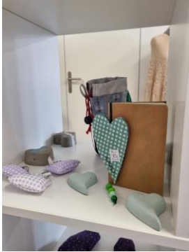
Kallax 1 Würfel, weiss 20.-/Mte