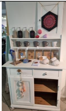
Antik Möbel gross, weiss 80.-/Mte