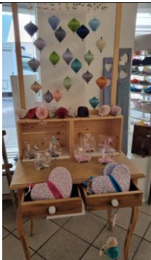
Tisch mit Aufsatz, braun 50.-/Mte