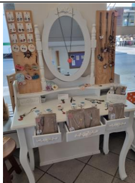
Schminktisch breit, weiss 50.-/Mte