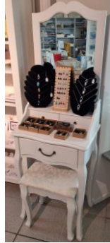
Tisch mit Spiegel klein, weiss 40.-/Mte