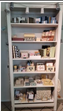
Grosser Schrank, weiss 100.-/Mte