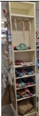
Hohes, schmales Regal, weiss 60.-/Mte