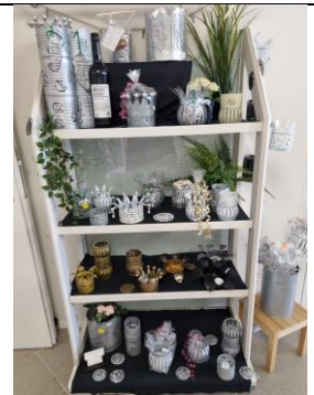
Rollregal mit Glasrückwand, hellgrau 50.-/Mte