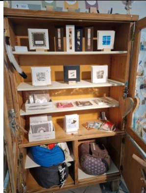
Schrank mit Glastüren oben, braun 120.-/Mte