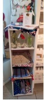
Ziehtablar Möbel, weiss 40.-/Mte